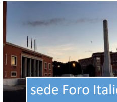
sede Foro Italico

info e prenotazioni: orientamento@juris.uniroma2.it per maggiori informazioni: www.giurisprudenza.uniroma2.it